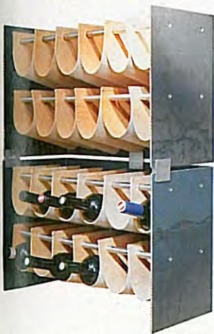
Formvollendet lagert edler Wein in den tiefen Lederschlaufen des schlanken Metallregals.

Kataloganforderung bei „Das Möbel“, Burggasse 10, 1070 Wien, Tel.: 01/524 94 97 12 oder per E-Mail: an@dasmobel.at