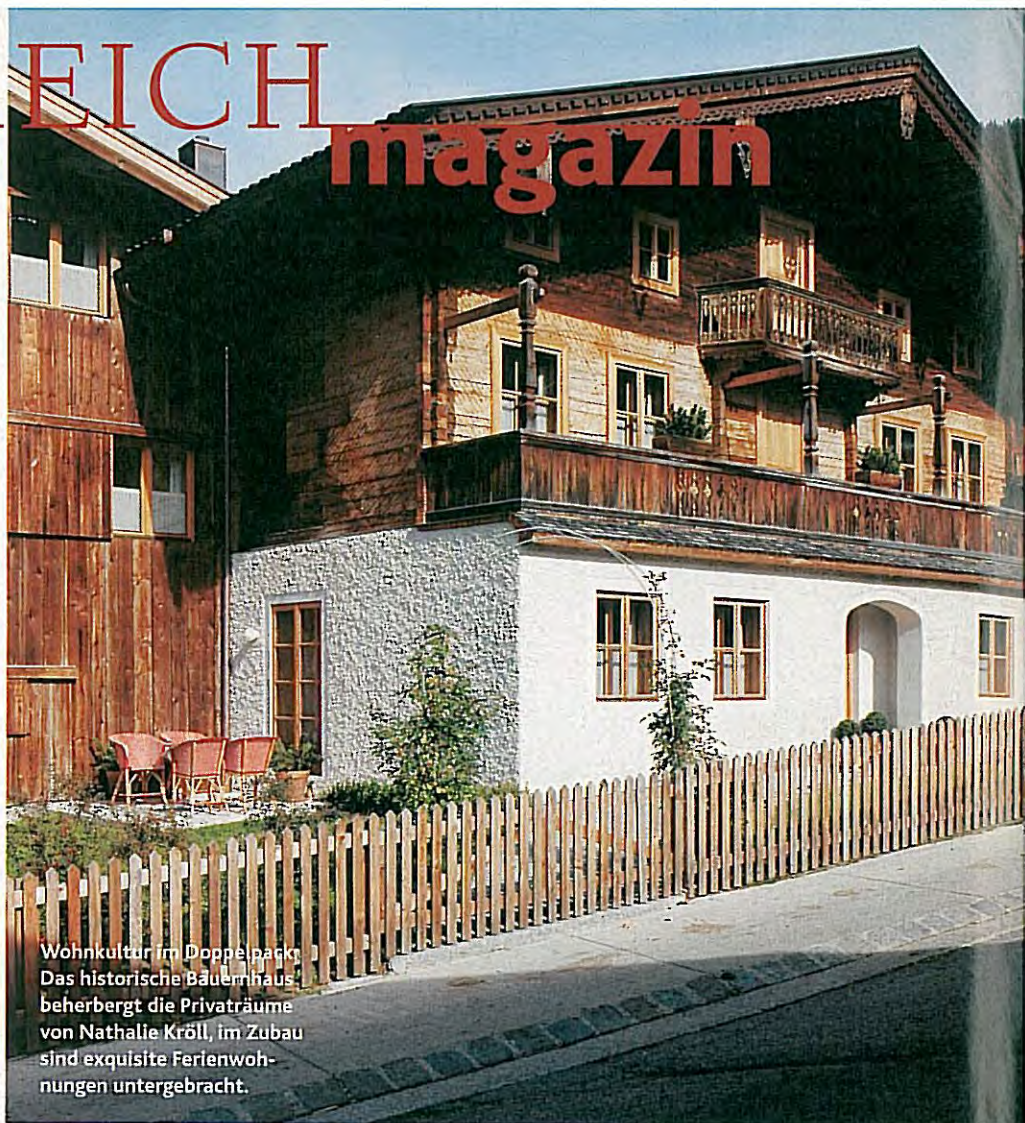
Wohnkultur im Doppelpack: Das historische Bauernhaus beherbergt die Privaträume von Nathalie Kröll, im Zubau sind exquisite Ferienwohnungen untergebracht.