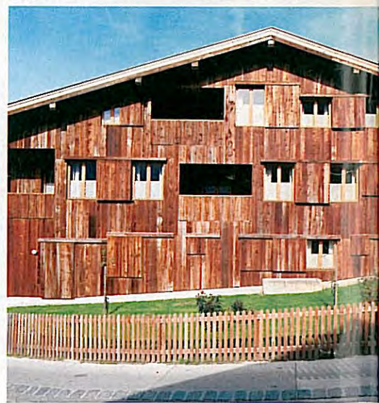
Rustikal und doch modern: Die ungewöhnliche Kombination von altem Holz und aktuellem Design bildet einen interessanten Blickfang.

A LS GELUNGENER BRÜCKENSCHLAG zwischen regionaler Bautradition und zeitgemäßer Architektur präsentiert sich dieses Hausensemble, das Martin Feiersinger im Zillertal realisierte. Bauherrin Nathalie Kröll wünschte sich eine Modernisierung des aus dem 19. Jahrhundert stammenden Bauernhofes, wobei auch Platz für Ferienwohnungen geschaffen werden sollte. Das feingliedrige Bauernhaus wurde behutsam renoviert, der seitlich angebaute, mehrfach veränderte Stall musste allerdings abgetragen werden. Die heikle Aufgabe, ein modernes Haus in die gewachsene dörfliche Struktur zu setzen, löste der Planer auf originelle Weise. Sein Neubau entspricht im Zuschnitt dem ehemaligen Nutzgebäude und